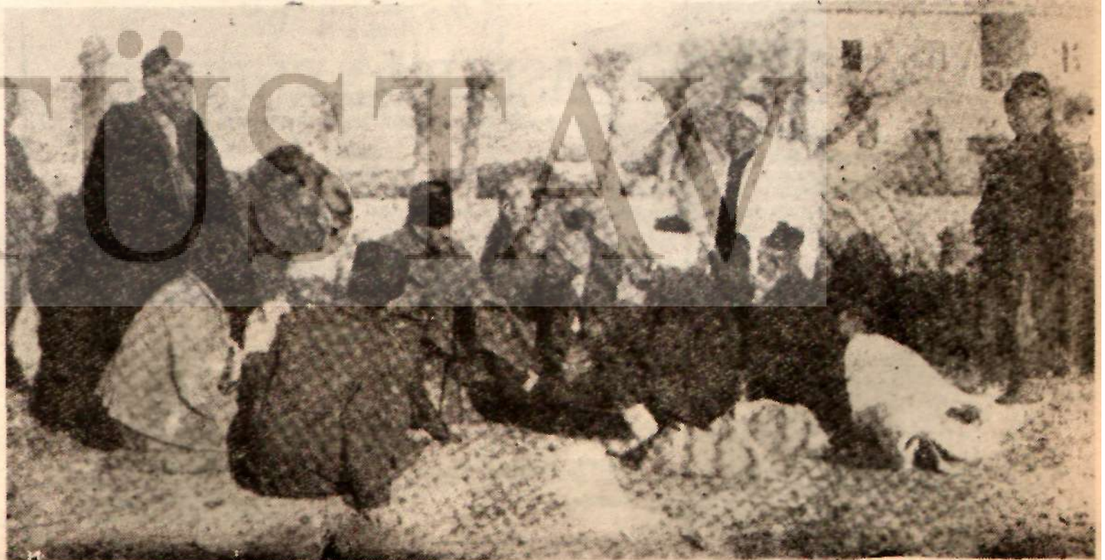
Mustafa Kemal halk arasında....