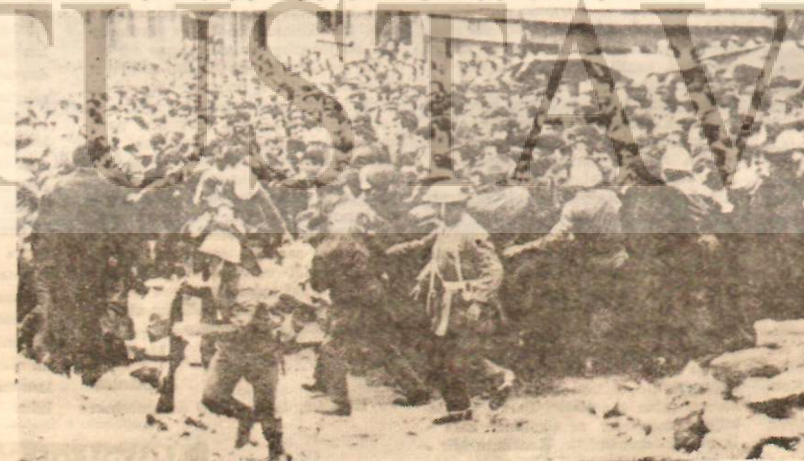
İstanbul'da gençlik yürüyüşü «100 bin Turban...»