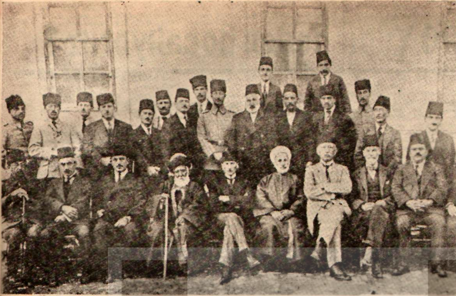
Mustafa Kemal, Sivas Kongresine katılan delegele, arasında

geleceğini... Yılızın ilk istediği onun İstanbul'da dönmesidir. İstanbul'da nice büyük mevkiler kendisini beklemektedir! Hülâsa kaypak, mîhrî Osmanlı ağız konuşur durur. Mustafa Kemal dayatınca bu ağız değişir. Hiç olmazsa Erzurumdan ayrılmasını, Anadolu'nun istediği yerinde bir tebdilîhava almasını isterler. O da nâfile. Mustafa Kemal Erzurum'da kalacaktır. Sonra telgraflaşma büsbütün sertleşir. Perdenin sonu yaklaşmıştır ve nihayet perde iner: Yıldız onu askerlik hizmetinden affetmeye girişirken Mustafa Kemal daha atik davranır. Mesleğinden, hizmetlerinden istifa ettiğini bildirir. Karar verilmiştir: 8/9 Temmuz 1919. Gece. Saat 10.50... Fakat asıl bildirisini Orduya ve millete yayınlar: Resmî sıfat ve salâhiyetten mücerret olarak, yalnız milletin şefkat ve cıvanmertliğine güvenerek ve onun bitmez tükenmez feyz ve kudret kaynağından ilham ve kuvvet alarak, vicdânî vazifesine devam edecektir. Millet'in bağrında bir ferdi mücâhit olarak çalışacaktır.