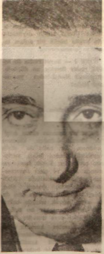
Salâh Bittâr Federasyona doğru

Birleşik Arap Cumhuriyeti ve Irak bu toplantıda yerlerini almışlar, Suriye 8 Mart'ta düşürülen idare sırasında Nâsır'a karşı